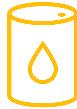
น้ำมันดิบ